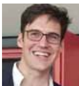
Von Gustavo Brinholi

Spielt die Realität eine entscheidende Rolle in meinem Leben?