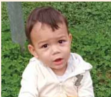
Patrik, geb. im August 2020

(Aus Datenschutzgründen geben wir nicht die richtigen Namen der Kinder an, sondern jeweils das Kennwort des Spendenaufrufes)