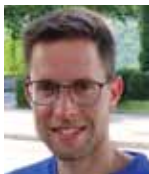
Von Tobias Degasperi

Seit Herbst 2020 diskutiert man in Rom und v.a. in den Medien über den Gesetzesentwurf „Zan“ - eingebracht vom PD-Politiker Alessandro Zan -, der Homophobie unter Strafe stellen will, aber auch weitgehende Einschränkungen der freien Meinungsäußerung vorsieht, sobald es sich um vermeintliche Diskriminierung von sexuellen Minderheiten handelt. Berechtigterweise sehen viele Politiker, christliche Organisationen, Lebensschützer und die katholische Kirche darin eine Gefahr für die öffentliche Debatte in Italien. Mit großer Anspannung wurde der Ausgang der geheimen Abstimmung im Senat am 27. Oktober 2021 verfolgt. Durchgesetzt hatten diese Abstimmung die Parteien Lega und Fratelli d'Italia. 154 Senatoren stimmten schließlich gegen den Gesetzesentwurf, 131 waren dafür. Damit kehrt der Vorschlag in die Justizkommission zurück und müsste neu erarbeitet werden. Das bedeutet einstweilen Waffenstillstand, der Kampf um die Deutungshoheit geht aber munter weiter.