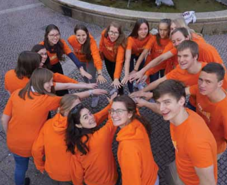
Beim Marsch für das Leben 2020 in Berlin