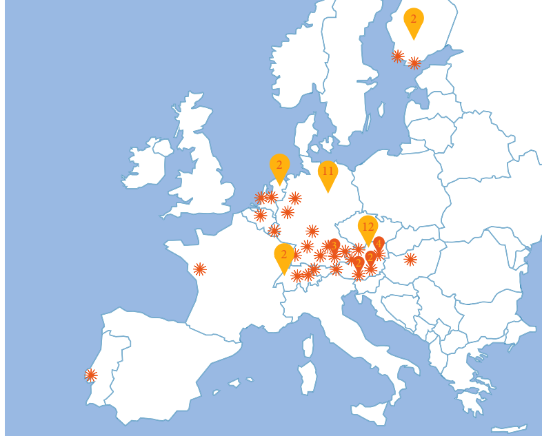
Momentan ist ProLife Europe in 10 Ländern mit 33 Gruppen vertreten.