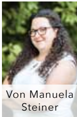
Von Manuela Steiner

Schüler und Studenten, die in Europa – unter einem Banner vereint – für die Ungeborenen kämpfen. Gemeinsam, unter einem Namen, mit der gleichen Botschaft. Das war der Traum, der uns dazu führte,